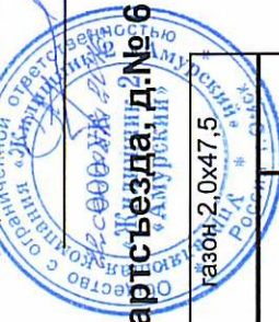
СХЕМА ПРИДОМОВОЙ ТЕРРИТОРИИ МКД по ул.22 Партсъезда д.№ 6